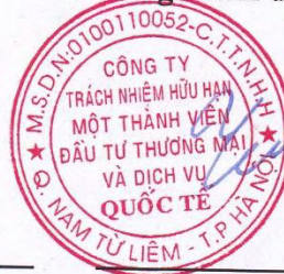
Phạm Văn Yên

Các thuyết minh từ trang 20 đến trang 62 là một bộ phận hợp thành của Báo cáo tài chính